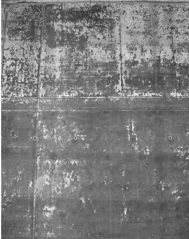
Bild 4: Ausblühungen an dunkler, im Winter betonierter Wandfläche

Beton an bevorzugten Bahnen abläuft (z. B. aus Schalungsankerlöchern, Abfluss von Wasser von der Wandkrone). Das Oberflächenwasser steht in direktem Kontakt mit dem Porenwasser des frischen Betons und besitzt einen Überschuss an Calciumhydroxid. Besonders lösungsintensiv für das Calciumhydroxid im Beton ist Regen- und Tauwasser, da diese Wässer noch keinen oder nur einen geringen gelösten Mineralgehalt haben.